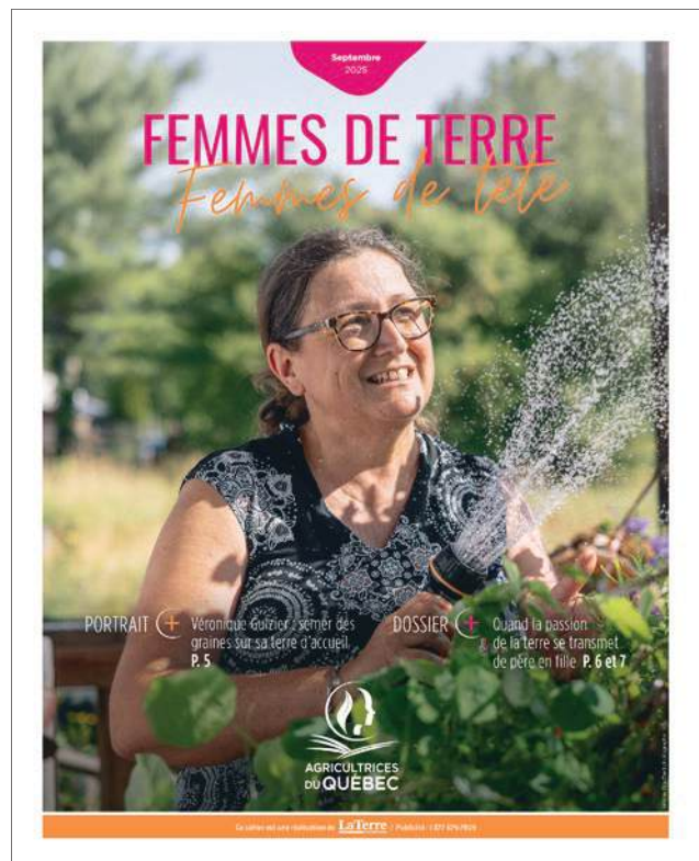
FTFT en collaboration avec La Terre en 2025