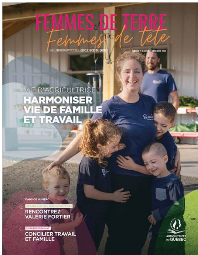
FTFT en 2024