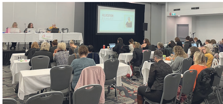
L'AGA des Agricultrices du Québec aura lieu les 17 et 18 octobre à Drummondville.

Réservez votre place pour l'AGA ou le gala sur agricultrices.com/gala .