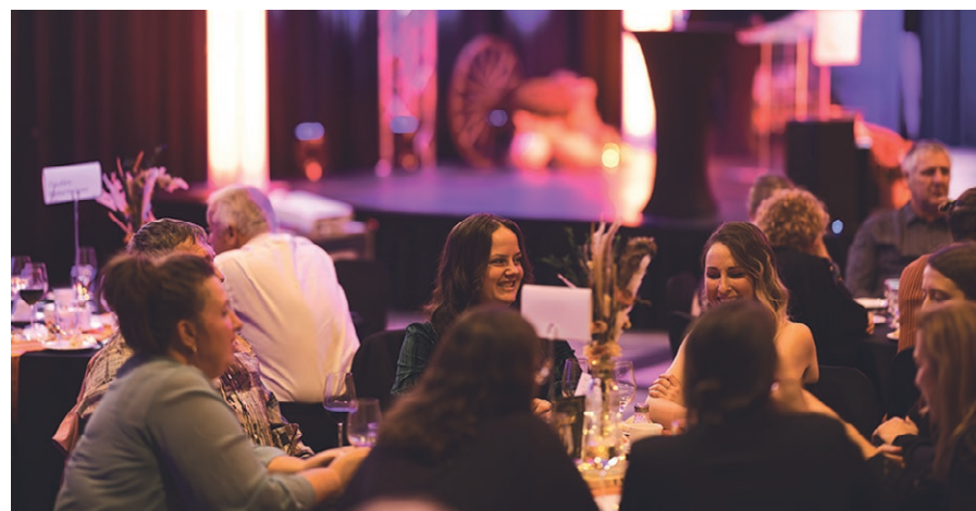
Réunissant plus de 250 personnes, le Gala Agricultrices du Québec est un moment unique pour honorer les femmes qui façonnent l'agriculture québécoise.