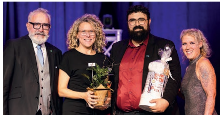
Les Éleveurs de porcs du Québec ont remporté le prix Allié lors de l'édition 2024 du Gala Agricultrices du Québec.