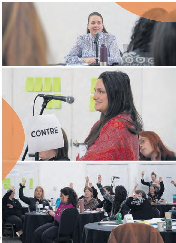
Agricultrices du Québec

La journée a également inclus une simulation de plénière, qui a été particulièrement appréciée par les participantes. Elles ont également eu l'occasion d'échanger avec des agricultrices passionnées de toutes les régions, des femmes déterminées à faire bouger les choses dans le milieu agricole. Cette journée témoigne bien de leur volonté de participer activement aux discussions et aux décisions du secteur.